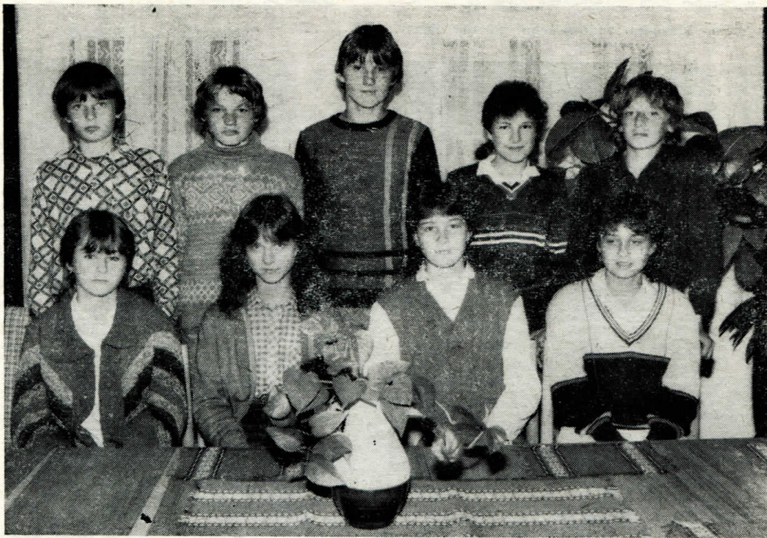
S představiteli obce pobesedovali v červnu žáci 8. tříd, kteří letos opustili základní školu